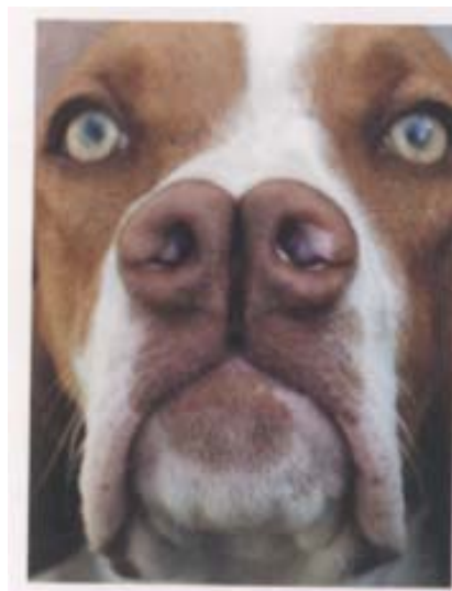
Bracco spagnolo a naso doppio